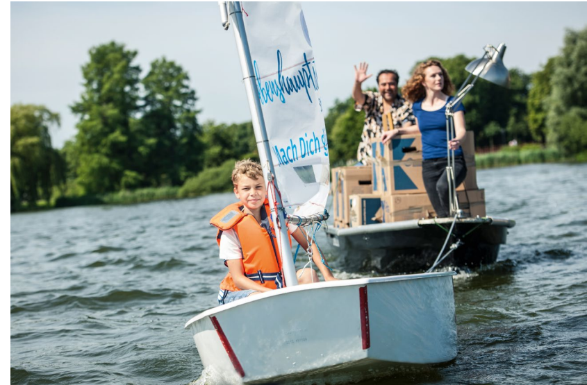
Stand der Kampagnenmotive: August 2017