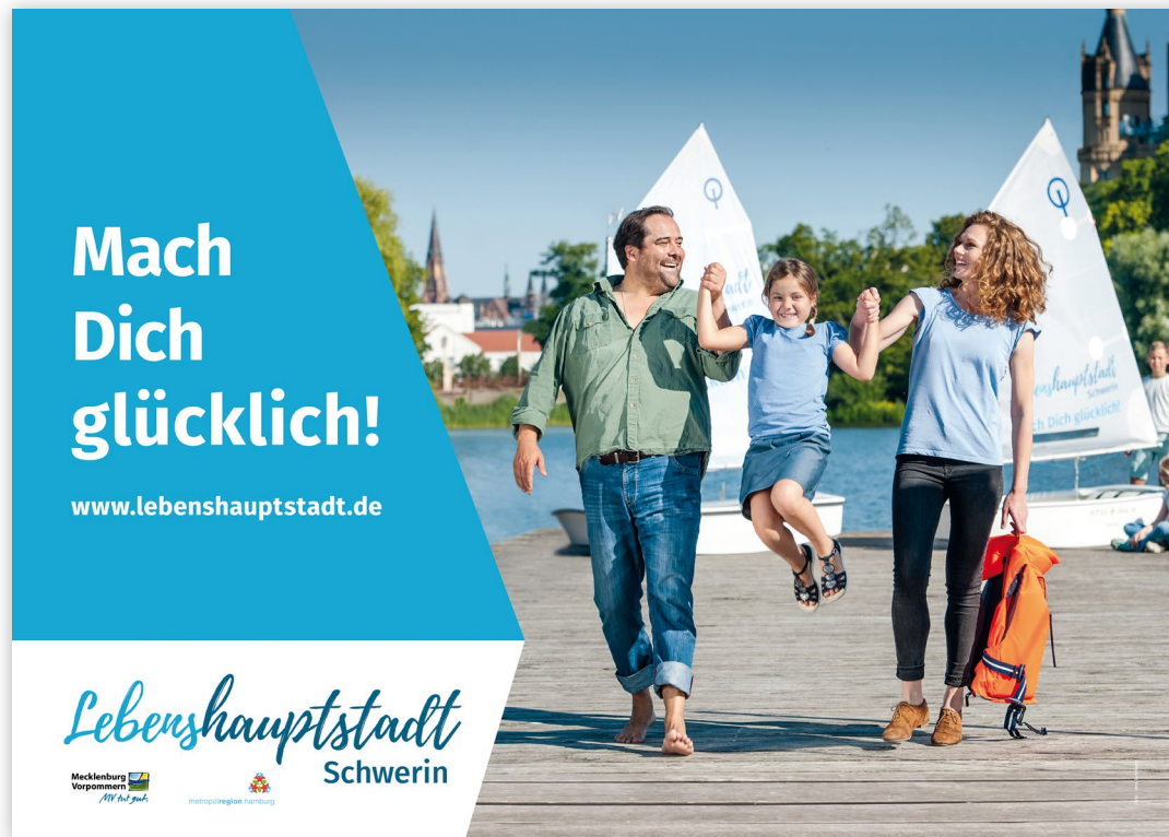
Anwendungsbeispiel Großflächenplakat 18/1

Das grafische Element wird immer links platziert. Es nutzt in der Höhe das gesamte Publikationsformat aus und schließt oben, unten und links bündig mit dem Formatrand ab.