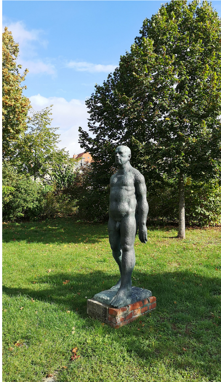
Großer Schreitender Mann auf dem Gertrudenfriedhof in Güstrow