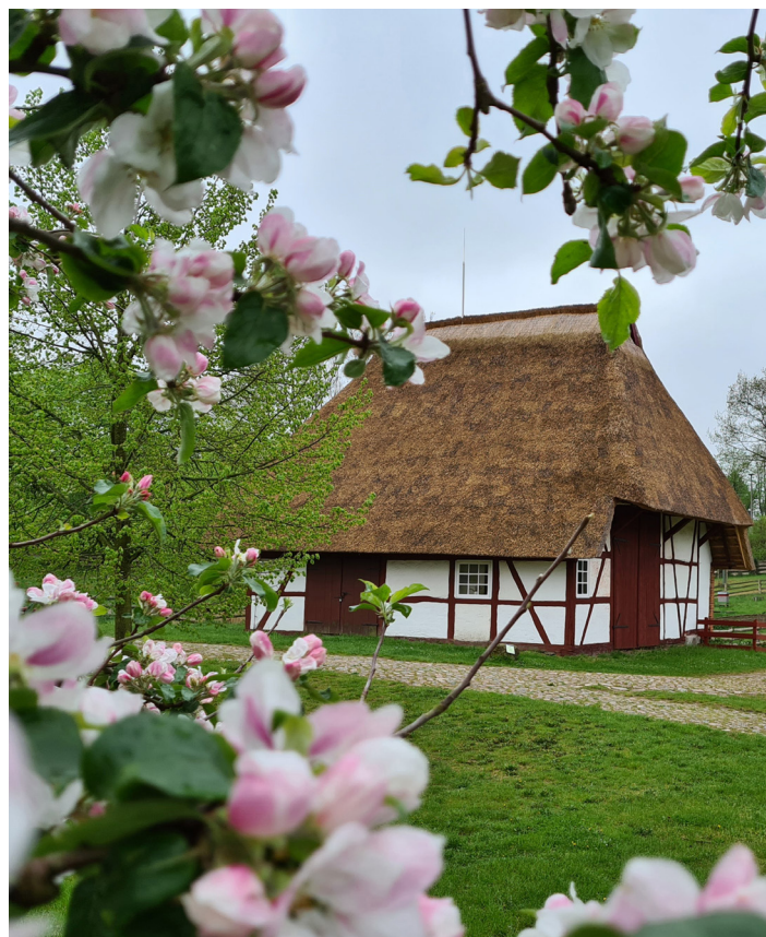
Das Freilichtmuseum in Schwerin-Mueß eröffnet seine Saison am Osterwochenende.

Um 11 Uhr lädt Kräuterexpertin Anne-Katrin Schmiedehaus-Engel die Besucherinnen und Besucher des Freilichtmuseums zu einer Kräuterwanderung unter dem Motto „Grüne Vitamine“ ein. Es folgt um 15 Uhr die feierliche Eröffnung der Sonderausstellung im Kunstkaten mit