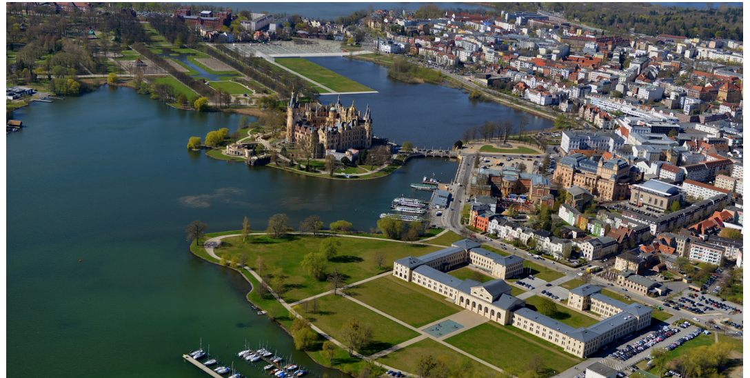
Die Entscheidung über die Aufnahme des Residenzensembles auf die UNESCO-Welterbeliste fällt im Sommer 2024.

Neben existierenden Schutzmaßnahmen und gesetzlichen Regelungen zeigt der Managementplan auch Risiken und Herausforderungen im Erhalt auf und definiert die Leitlinien für das zukünftige Management der potenziellen Welterbestätte. Übergeordnete Zielstellungen sind dabei die