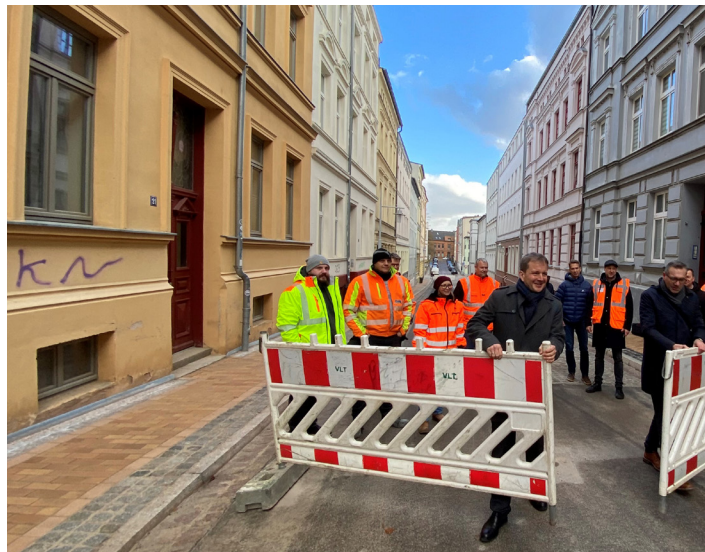
Für den Verkehr freigegeben: die sanierte Landreiter- und Hospitalstraße in der Schweriner Schelfstadt.

Die Sanierung erfolgte in zwei Abschnitten mit Baubeginn im Juni 2020. Der erste Abschnitt, die Landreiterstraße zwischen Schelf- und Bergstraße, ist 128 Meter lang.