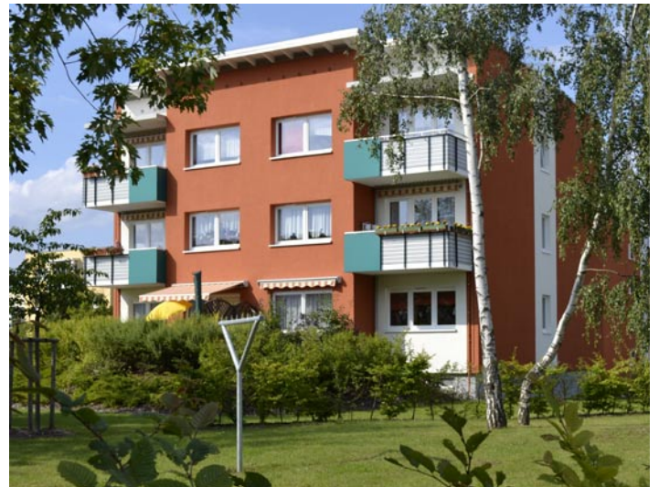
Gute Beispiele für energetische Sanierung gibt es auf dem Großen Dreesch.

Als begleitende Umsetzungsinstrumente schlagen die Gutachter u.a. den Aufbau einer Leitstelle Klimaschutz, ein Energieforum für die Industrie, spezielle Umwelttarife bei Strom und Fernwärme und ein Abwärmekataster vor. Das Klimaschutzkonzept wurde von dem Gutachterteam MegaWATT, Metropol Grund und LK-Argus in enger Zusammenarbeit mit dem Amt für Umwelt erarbeitet. Wesentlicher Baustein dabei waren drei Klima-