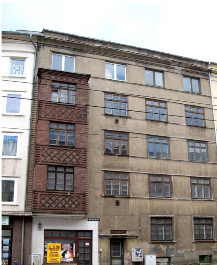
Wismarsche Straße 198

Ein Verkauf der Grundstücke bedarf der Beschlussfassung durch das zuständige städtische Gremium der Landeshauptstadt Schwerin. Die Landeshauptstadt Schwerin behält sich vor, von einem Verkauf der Grundstücke abzusehen, zu Nachgeboten aufzufordern oder die Grundstücke erneut anzubieten. Diese und weitere Grundstücksangebote der Landeshauptstadt Schwerin finden Sie auch unter www.schwerin.de unter Bürgersevice/Bauen & Wohnen/Immobilien.