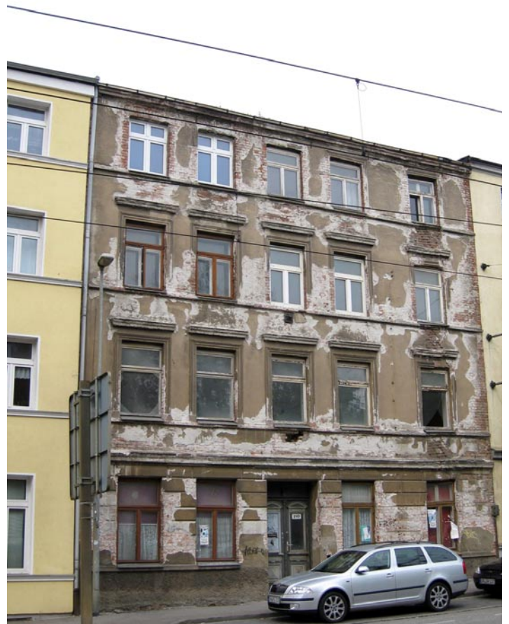
Wismarsche Straße 210

Die Bebauung besteht aus einem viergeschossigen Mehrfamilienwohnhaus in traditioneller Bauweise (Ziegelmauerwerk). Das Gebäude wurde um 1900 errichtet und ist voll unterkellert. Auf dem Hof befindet