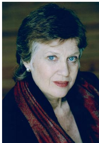
Schauspielerin Monica Gruber

Im szenischen Spiel zeigt sie ihre komödiantischen Fähigkeiten. In ihren Moderationen beleuchtet